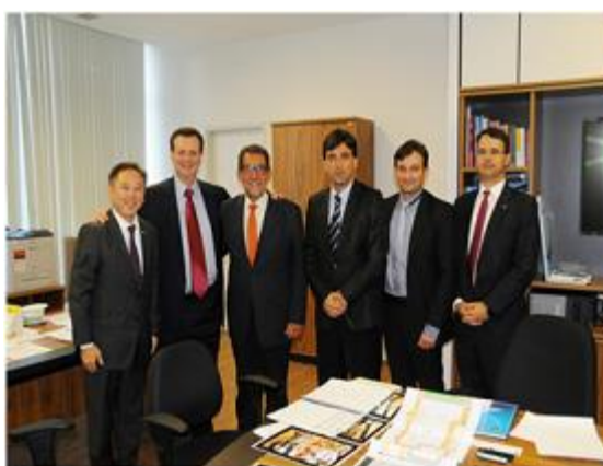
Figura 13 - Reunião dos representantes do CITec-Marília e CIEM no Ministério de Ciência, Tecnologia, Inovações e Comunicações

No UNIVEM também se situam o Centro Incubador de Empresas de Marília-CIEM e o Centro de Inovação Tecnológica de Marília/CITec-Marília que são importantes agentes indutores e incentivadores do empreendedorismo e inovação na região, estes ambientes de inovação são credenciados ao Sistema Paulista de Ambientes de Inovação do Governo do Estado de São Paulo e têm a FEESR como entidade gestora.