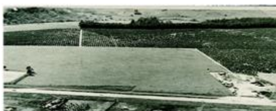
Figura 5 - Área doada pela prefeitura de Marília/SP para a construção do prédio da Fundação