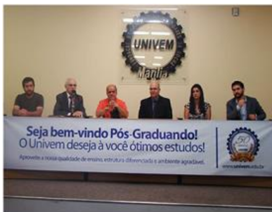
Figura 16 - UNIVEM inova em Núcleo de Educação à Distância