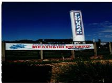
Figura 8 - Mestrado em Direito na Fundação Eurípides