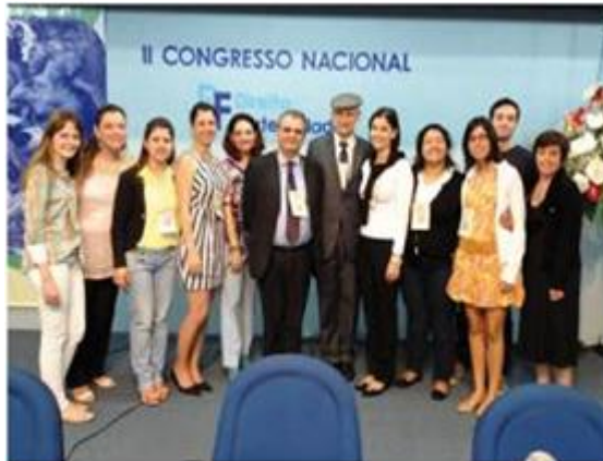
Figura 15 - Mestrado em Direito UNIVEM no II Congresso Nacional de Direito e Fraternidade em 2013