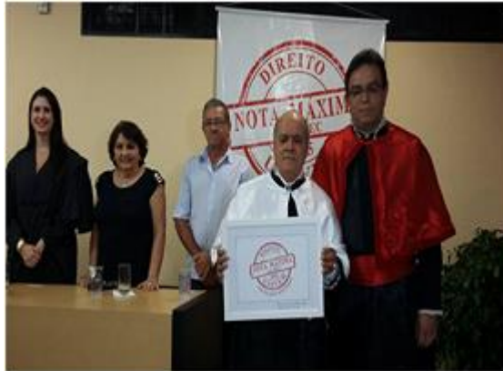
Figura 14 - Direito do UNIVEM conquista a nota máxima em avaliação do Ministério da Educação-MEC em 2015