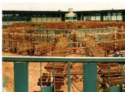
Figura 7 - A Instituição em reforma para a abertura de novos cursos do Ensino Superior